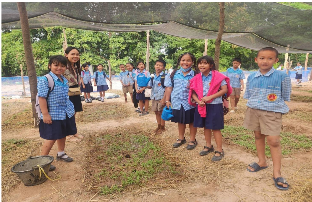
กิจกรรมปลูกผักสวนครัวกับนักเรียน