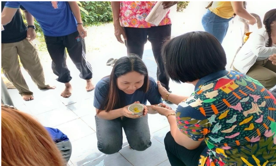
รดน้ำดำหัวขอพรมารดาเนื่องในวันสงกรานต์