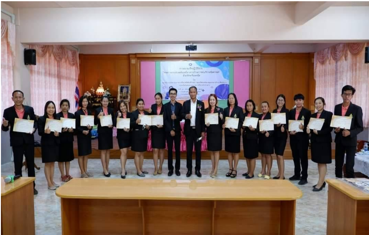
เป็นแบบอย่างที่ดีด้านความซื่อสัตย์สุจริต