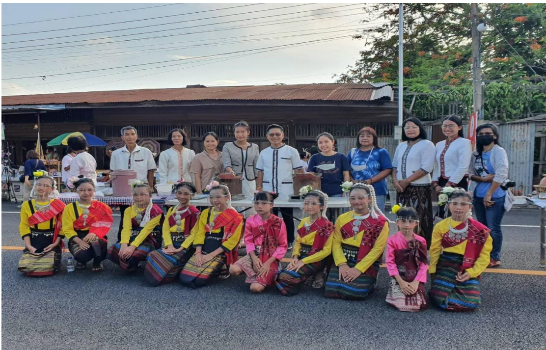
มีความรับผิดชอบต่องานในหน้าที่ งานที่ได้รับมอบหมาย และงานชุมชน