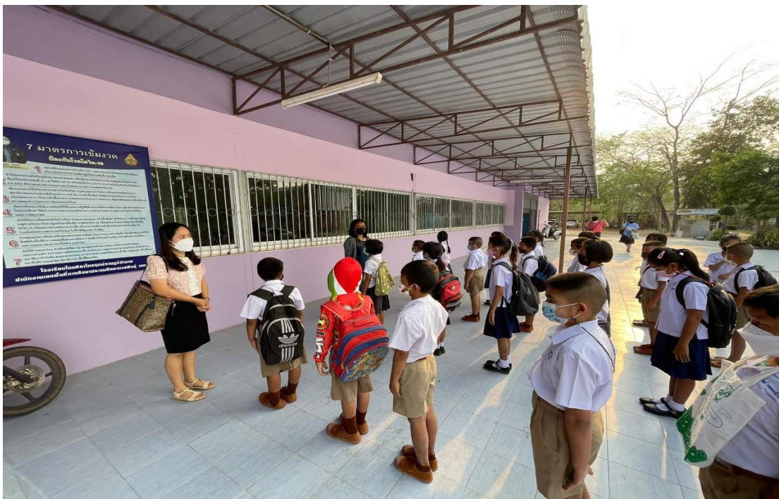
มีความรับผิดชอบต่อนักเรียน ดูแลเอาใจใส่จนเป็นที่รักของลูกศิษย์