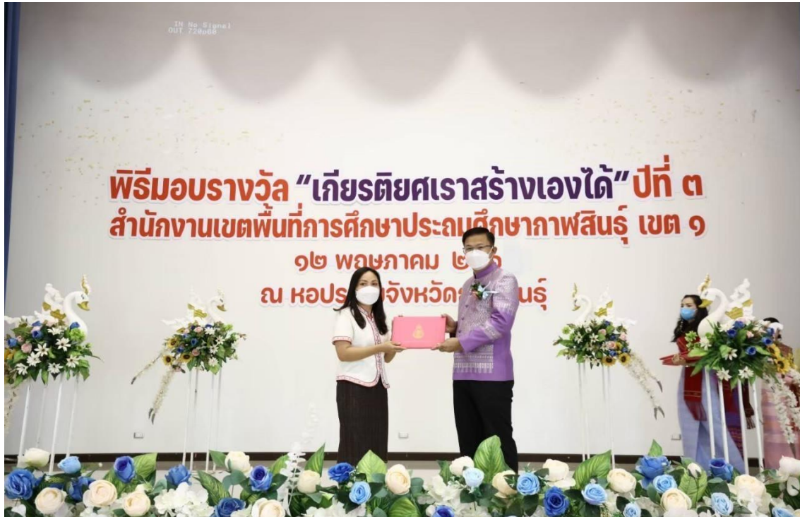
ร่วมรับรางวัลเกี่ยวกับความซื่อสัตย์สุจริต