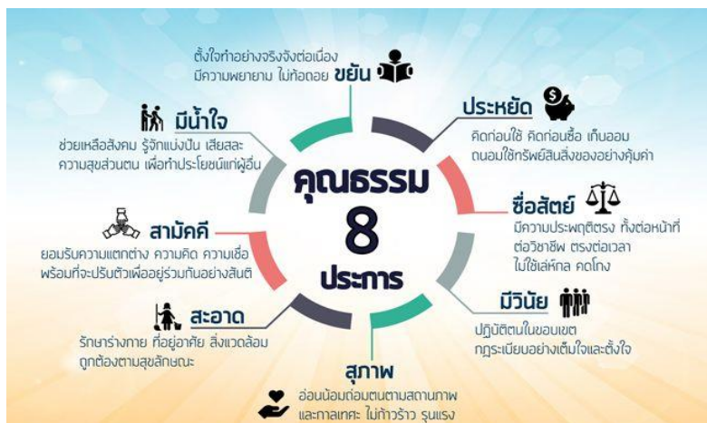
แผนภาพที่ 1 : คุณธรรม 8 ประการ

8) มีน้ำใจ คือ ความจริงใจที่ไม่เห็นแก่เพียงตัวเองหรือเรื่องของตัวเอง แต่เห็นอกเห็นใจเห็นคุณค่าในเพื่อน มนุษย์ มีความเอื้ออาทรเอาใจใส่ ให้ความสนใจในความต้องการ ความจำเป็น ความทุกข์สุขของผู้อื่น และพร้อมที่จะให้ความช่วยเหลือเกื้อกูลกันและกัน ผู้ที่มีน้ำใจ คือ ผู้ให้และผู้อาสาช่วยเหลือสังคม รู้จักแบ่งปัน เสียสละความสุขส่วนตน เพื่อทำประโยชน์แก่ผู้อื่นเข้าใจ เห็นใจ ผู้ที่มีความเดือดร้อน อาสาช่วยเหลือสังคมด้วยแรงกาย สติปัญญา ลงมือปฏิบัติการเพื่อบรรเทาปัญหา หรือร่วมสร้างสรรค์สิ่งดีงามให้เกิดขึ้นในชุมชน